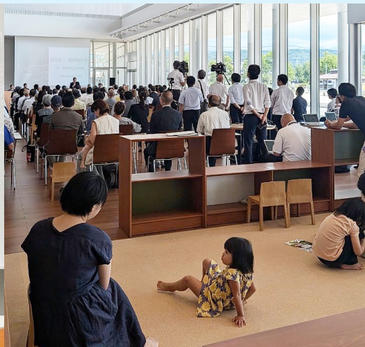
子ども達を含む、200名を超える多くの方がご来場