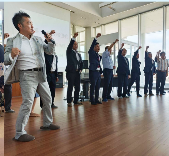
最後は、石破代議士の総裁選必勝コールで締め