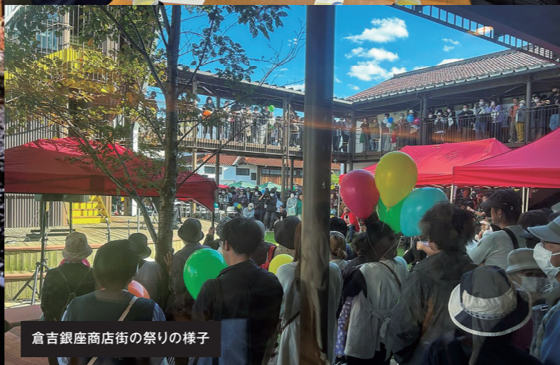
倉吉銀座商店街の祭り様子