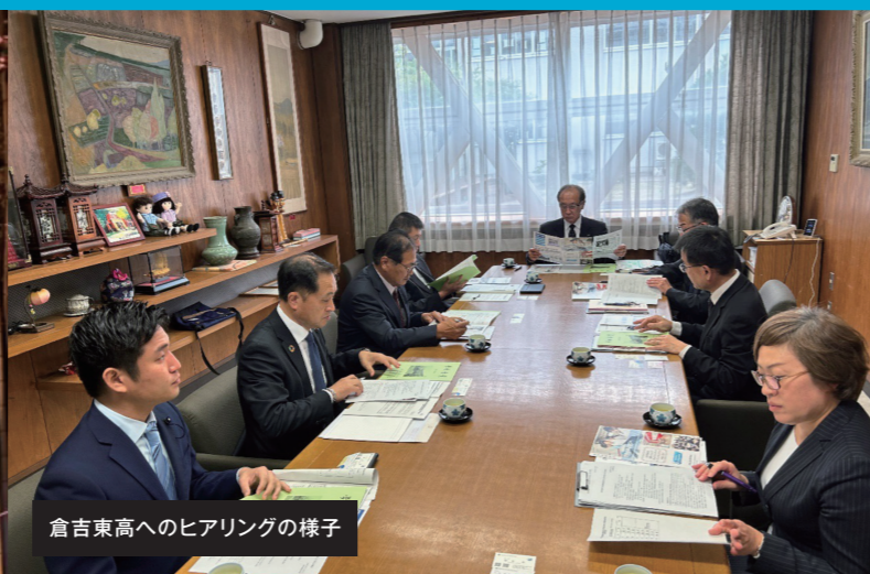
倉吉東高へのヒアリングの様子